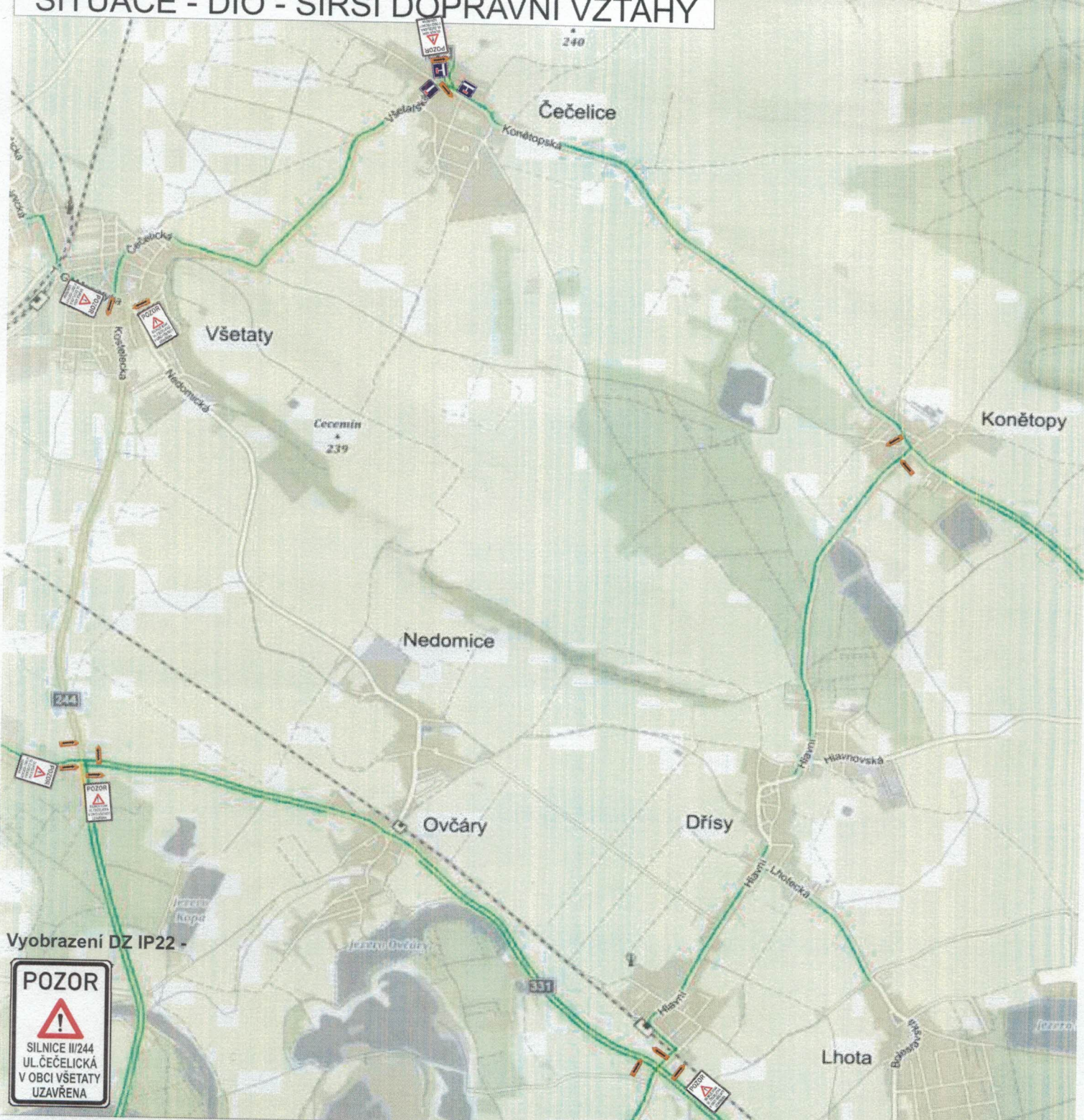
Vyobrazení DZ IP22 -